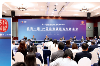
投资中国· 外国投资促进机构圆桌会