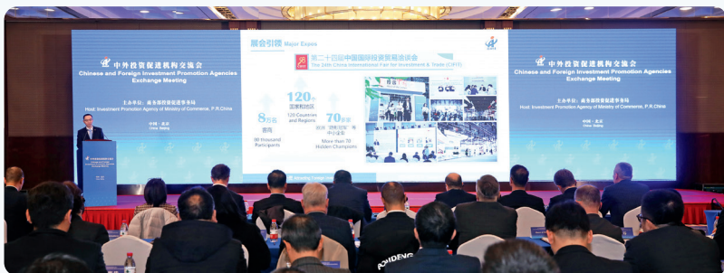
中外投资促进机构工作会