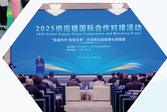
供应链国际合作对接活动