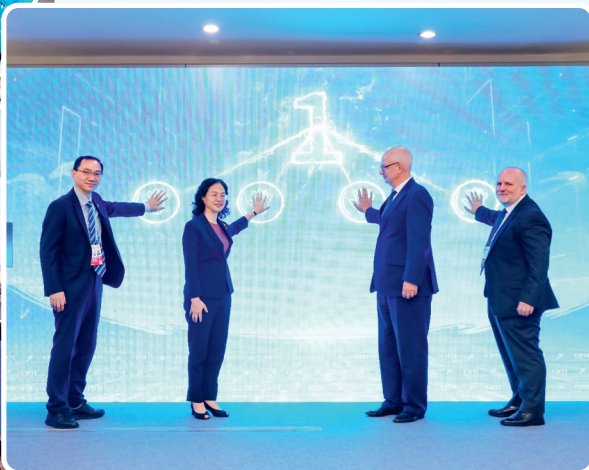
中英健康创新平台启动仪式