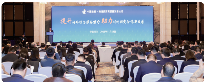
中国投资·跨境投资高质量发展论坛

支持国内链主和龙头企业安全、稳妥开拓海外市场，提供前期规划、环境考察、政策咨询、宣传推广、企业对接等全链条投资促进服务。