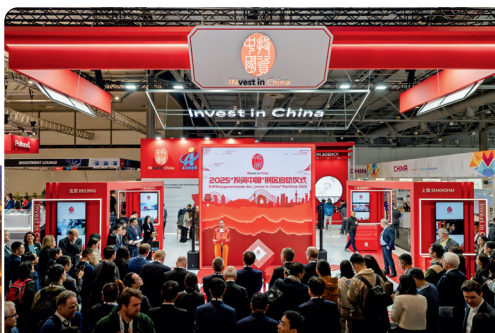
汉诺威工博会“投资中国”展区