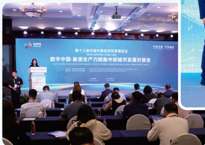
数字中国·新质生产力赋能中部城市 发展对接会