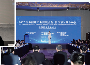
生命健康产业跨境合作· 对话 500 强活动