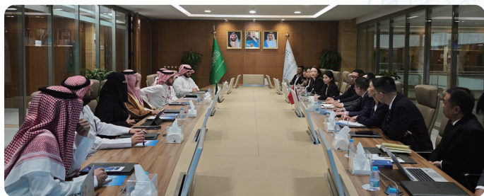
率数字产业代表团访问沙特