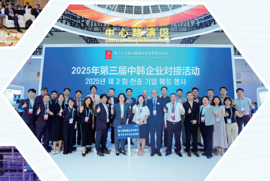
中韩企业对接活动