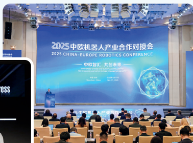
中欧机器人产业合作对接会