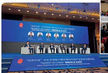
“投资中国”中东专场推介

商务部投资促进事务局承办商务部主办的“投资中国”相关活动，宣介中国投资环境，支持地方开展海外推介。