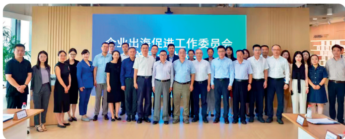
企业出海促进工作委员会