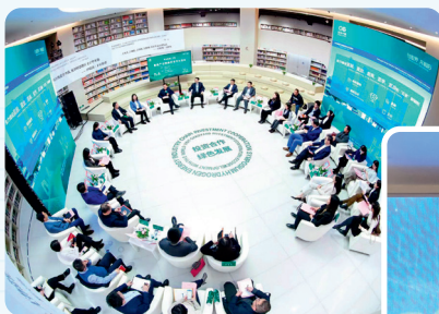
绿色中国·氢能产业链投资 合作交流会