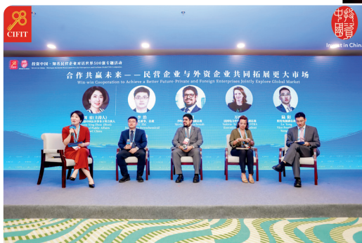
投资中国·知名民营企业对话世界 500 强专题活动